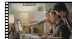
Vea videos del Gobierno de los EE. UU.